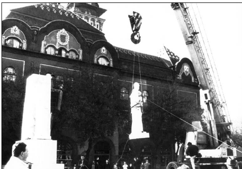
Прилог 8: Постављање фигура на постамент 1991. године